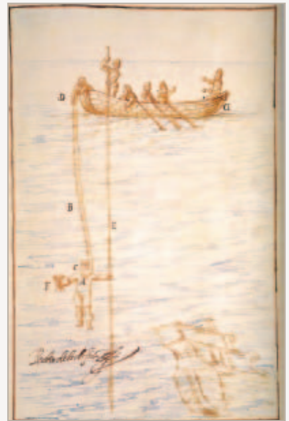
Buzo en Naufragio

Como era evidente que el Juncal estaba por rendirse, tripulación y pasajeros se prepararon para despedirse de este mundo. Comenzada la noche el navío ofreció sus últimos esfuerzos y empezó a inclinarse hacia estribor, el impulso de las olas lo levantó y lo colocó de manera que se fue hundiendo por la proa en menos de lo que se reza un credo.