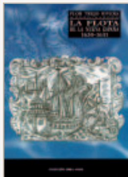
Libro de la autora