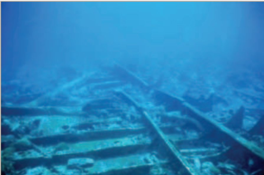
Restos del Naufragio

La historia de un naufragio no es sólo la historia de la lucha del hombre ante la manifestación de una naturaleza furiosa y hostil. Nos permite ver, entre restos de tablones, trazos de tinta en el papel y voces silenciadas por el mar, la capacidad del hombre por idear un maravilloso transporte como el barco y al mismo tiempo cómo se hunde en su propia codicia.